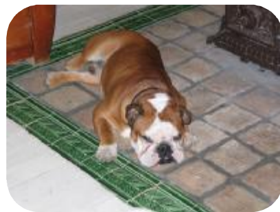
COATCH 18 mois