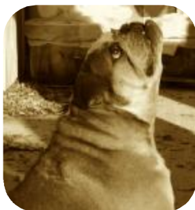
ULYSSE 6 ans