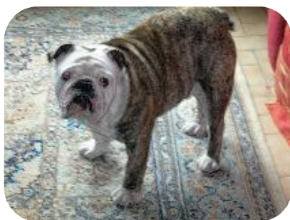
CASSUS 17 mois