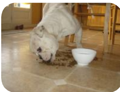
BETTY BOOP environ 2 ans Adoptée mi-janvier - fin mars = +7 kg