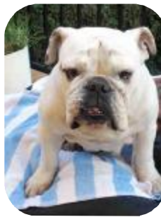
VANILLE 4 ans 1/2