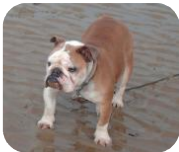
GASPAR 2 ans