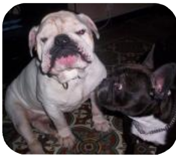
WINSTON 9 ans