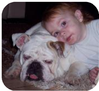
CHANA 15 mois

Depuis le dernier bulletin nous avons accueilli d'autres membres dans notre famille et ... ILS ONT ADOPTE LEURS NOUVELLES FAMILLES ! :=)