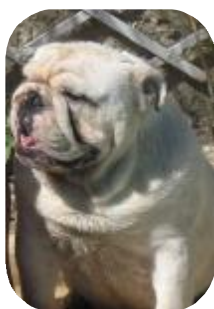
BUZZ L'ECLAIR 2 ans