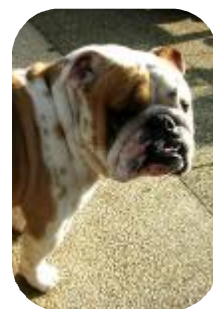
BUD 5 ans 1/2