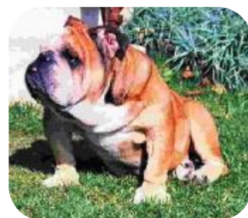
TEA TIME 7 ans