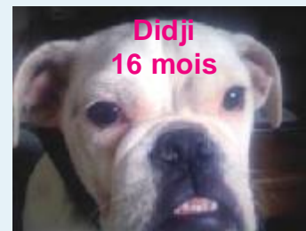
Didji 16 mois