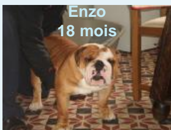
Enzo 18 mois