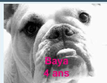
Baya 4 ans