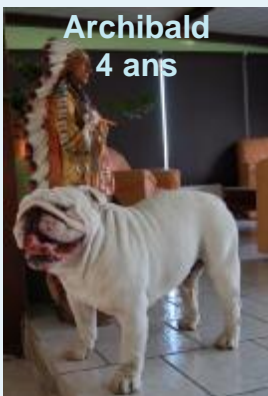
Archibald 4 ans