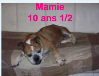
Mamie 10 ans 1/2