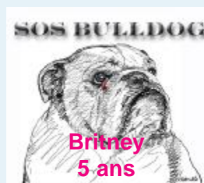
Britney 5 ans