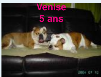
Venise 5 ans