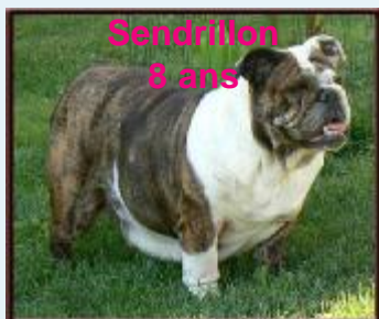
Sendrillon 8 ans