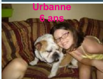
Urbanne 6 ans