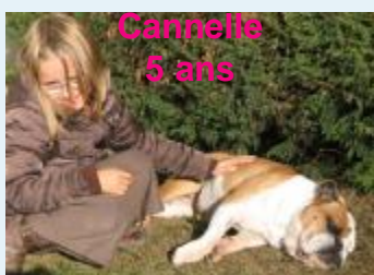
Cannelle 5 ans