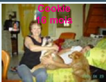
Cookie 16 mois