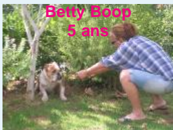
Betty Boop 5 ans