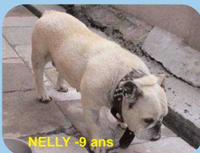
NELLY - 9 ans