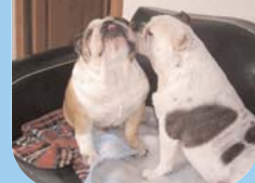
UGO 3 ans + TENDRESS - 4 ans ont trouvé une famille pour les accueillir tous les 2