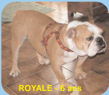
ROYALE - 6 ans