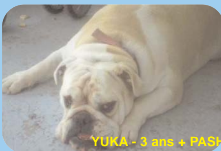
YUKA - 3 ans + PASHA - 5 ans... aussi