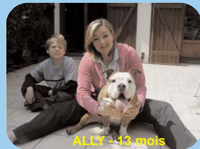
ALLY - 13 mois