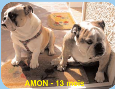
AMON - 13 mois