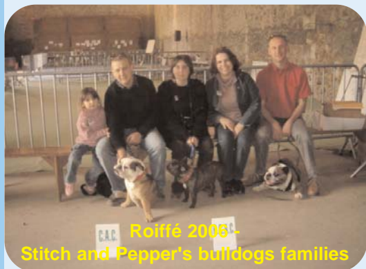
Roiffé 2008 - Stitch and Pepper's bulldogs families

La liste de diffusion est toujours un endroit aussi convivial pour "causer bulldog". Environ 60 personnes sont inscrites sur cette liste.