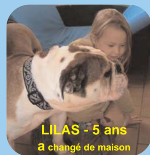
LILAS - 5 ans a changé de maison