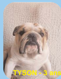
TYSON - 3 ans