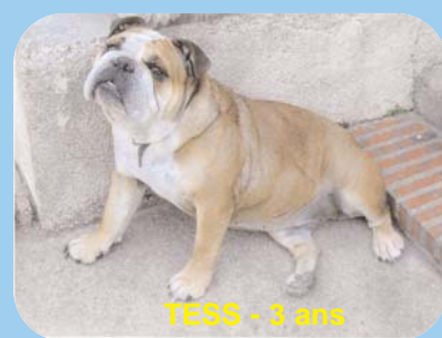
TESS - 3 ans