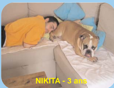
NIKITA - 3 ans