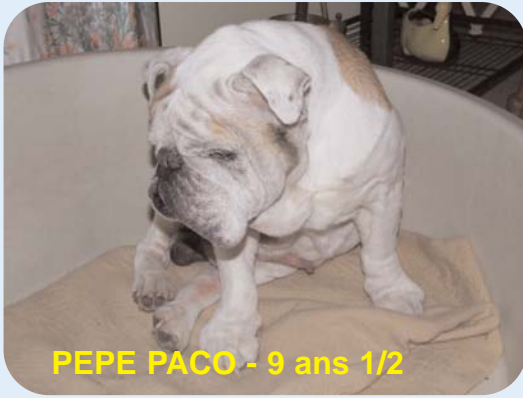
PEPE PACO - 9 ans 1/2