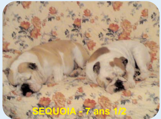
SEQUOIA - 7 ans 1/2