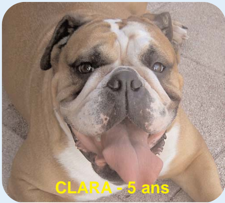
CLARA - 5 ans