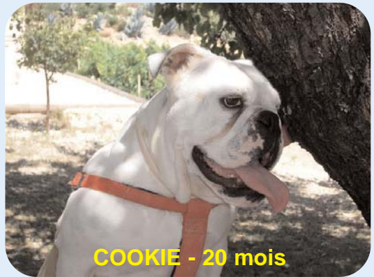
COOKIE - 20 mois