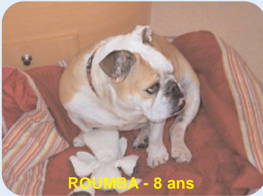
ROUMBA - 8 ans