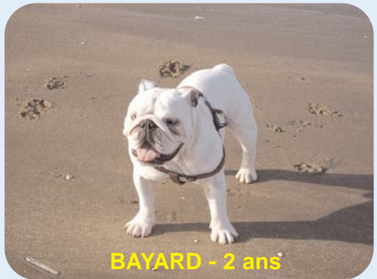
BAYARD - 2 ans