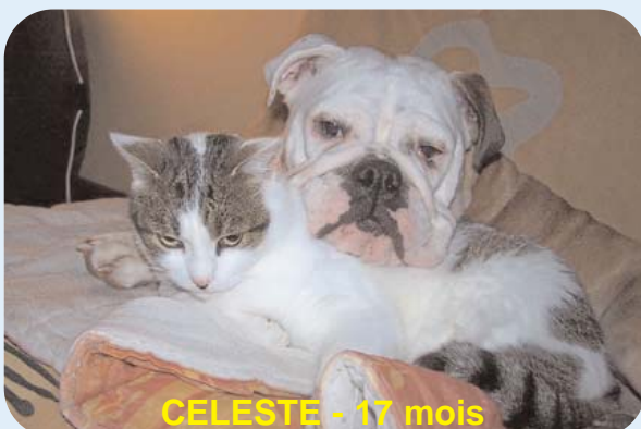
CELESTE - 17 mois