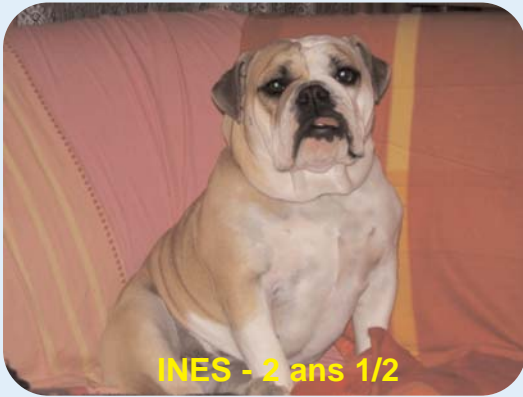
INES - 2 ans 1/2