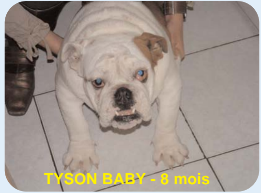
TYSON BABY - 8 mois