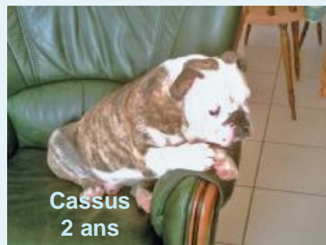
Cassus 2 ans