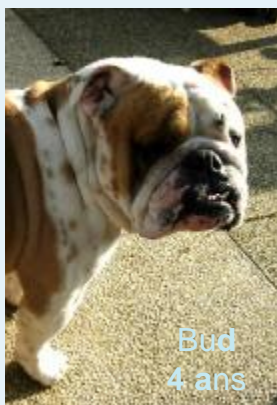
Bud 4 ans

Ci-après, ils sont entrés dans leur famille pour les faire " vivre en bulldog ".