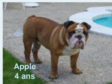
Apple 4 ans