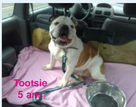
Tootsie 5 ans