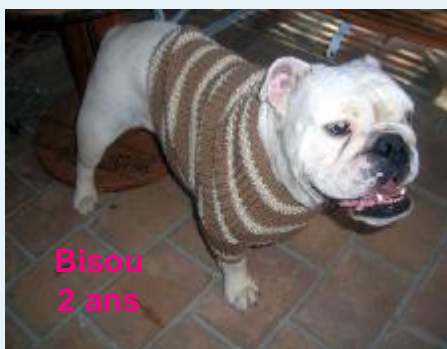
Bisou 2 ans