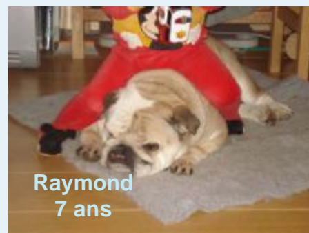
Raymond 7 ans

Le 30 juillet 2009, l'association SOS BULLDOG aura placé 200 bulldogs.