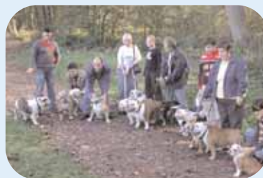
" AU NORD.. Y'AVAIT DES... BULLS HEUREUX "