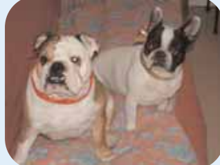
SIGJIE - RAYMOND