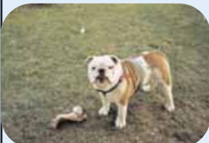
ELIOTT le savoyard

Sur ces 46 bulldogs répertoriés, il y a 20 bulldogs inscrits au LOF, 22 NON LOF et 4 dont je n'ai pas eu la certitude de leurs origines.