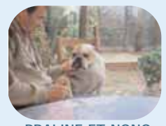
PRALINE ET NONO